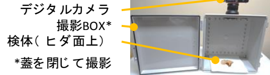
図1 撮影 Box（蓋が開いた状態）

検体には、山形県内の山林で採取したツキヨタケの子実体（以下、天然体）、菌床で栽培したツキヨタケの子実体（以下、栽培体）を用いた。比較対象としてムキタケおよびヒラタケを購入し用いた。